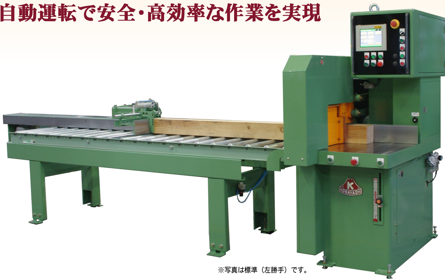
※写真は標準（左勝手）です。